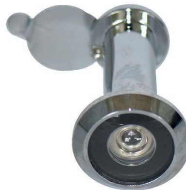
Grande collerette D.26mm

Commande par Boite (pas de commande à l'unité)