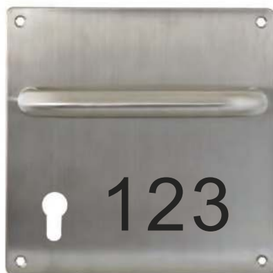
Plaque carrée avec poignée fixe horizontale