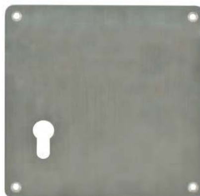
Plaque de poussée carrée

BDC -réf. IN244B 🔑 -réf. IN244CI Droite/Gauche