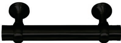
Noir Mat P.V.D. réf. IN510NO