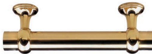
Or Brillant P.V.D. réf. IN510OB

Finitions colorées traitées P.V.D. * résistantes aux rayures et à la corrosion