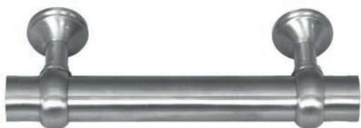
Inox Brossé mat réf. IN510