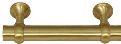
Or Satiné P.V.D. réf. IN510OS